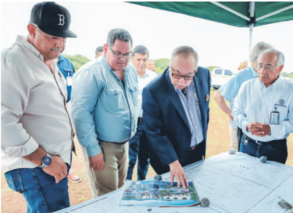
>>El director general y parte de su equipo inspeccionaron varias instalaciones.